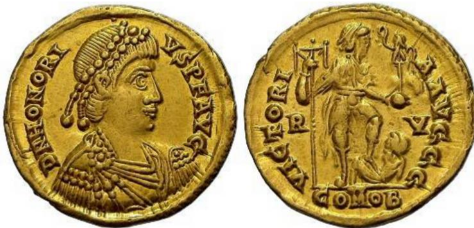
Kejsar Honorius (393-423) som förhandlade med visigoternas kung Alaric innan plundringen av staden Rom ägde rum.

Även före år 424 hade tributer betalats ut. Exempelvis fick den visigotiska kungen Alaric 4000 pund guld (1307 kg) under förhandlingarna år 410 och innan Rom skövlades.