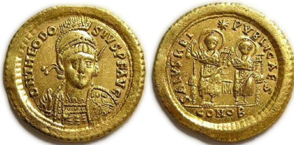
Solidus från kejsar Theodosius II:s regeringstid (402-450)