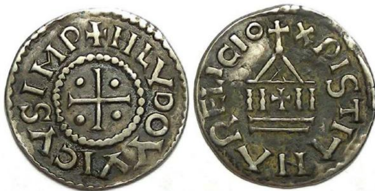
Frankiskt mynt från tiden när vikingafloetter ansatte Frankrike.

Efter 1012 utbetalades danagälden till underhåll för vikingahären som 1013 erövrade England, under ledning av den danske kungen Sven tveskägg. Den insamlades som en särskild skatt 1012-1051. Hans son Knut den store regerade både över Danmark, Norge och England under lång tid.